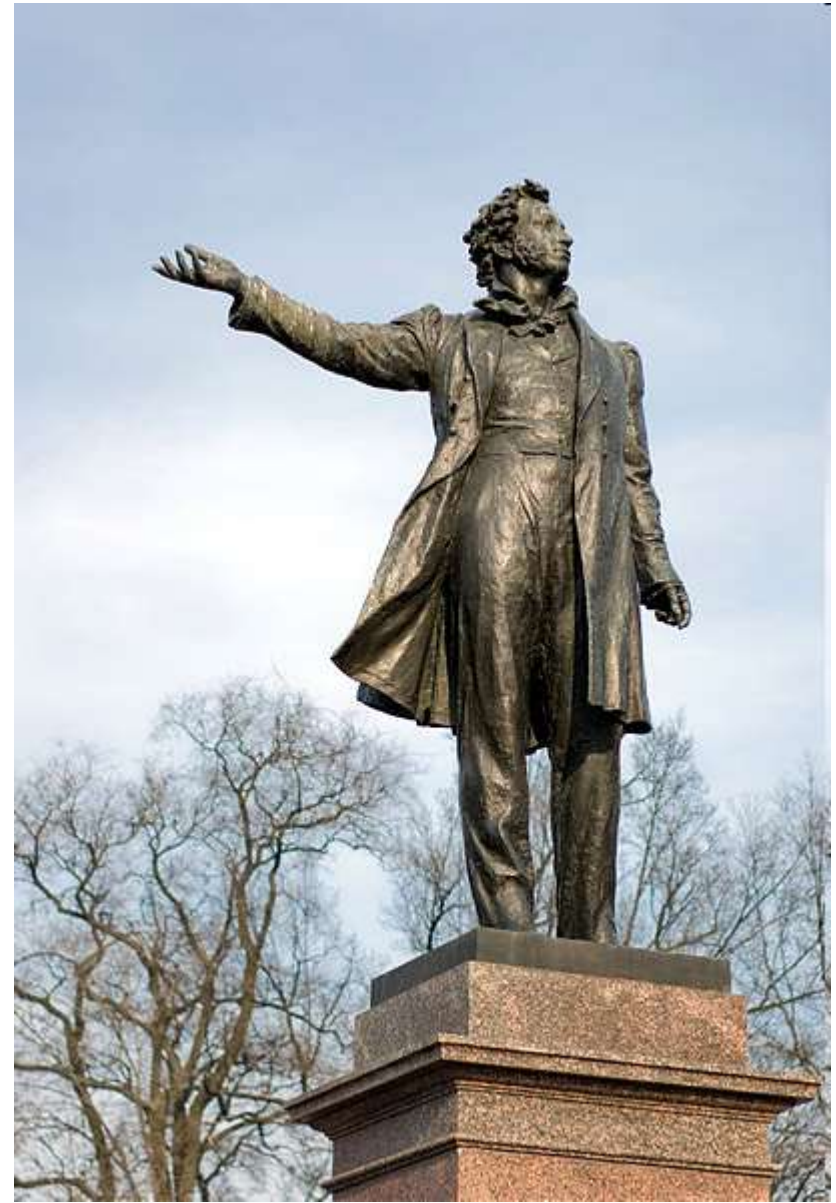
Памятник А.С. Пушкину на площади Искусств.