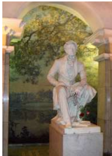
Скульптура на станции метро «Пушкинская».