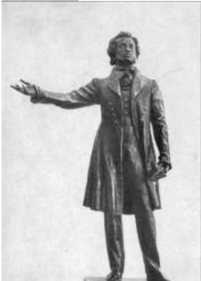
Эскиз фигуры к памятнику. 1950. Бронза.