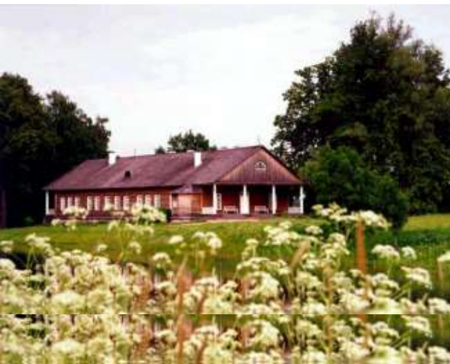
Тригорское. Музей-усадьба Осиповых-Вурлиц.