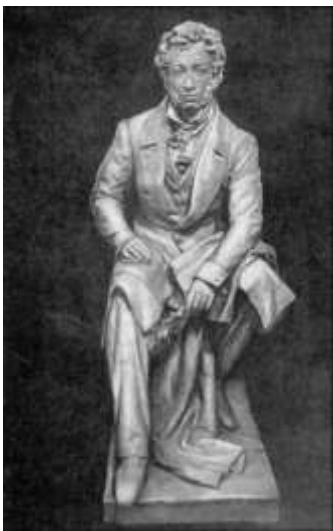
Модель скульптуры для станции метро «Пушкинская». 1955. Гипс.