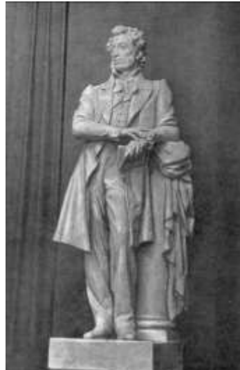
Модель скульптуры для МГУ. 1952. Гипс.