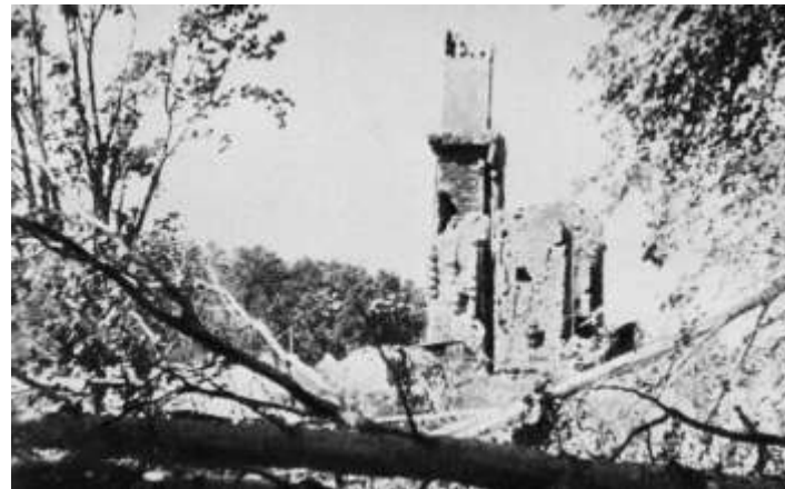
Пушкинский заповедник. 1944 год