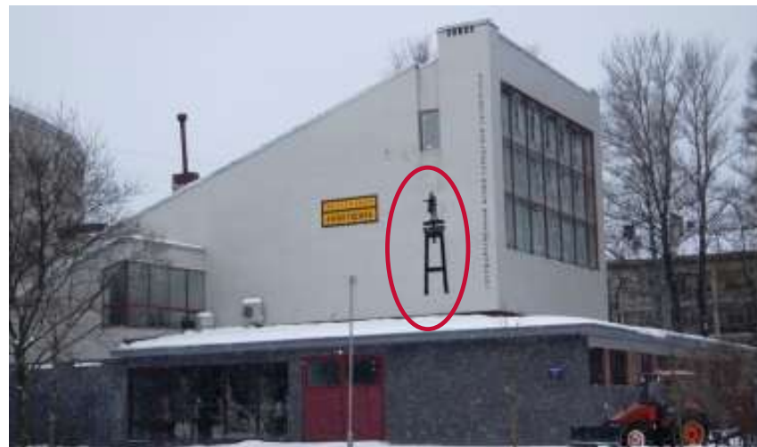
Музей «Мастерская Аникушина».

«Прежде чем к человеку подобраться, да еще к такому, как Пушкин, То сколько же надо пособий его сотворить!»