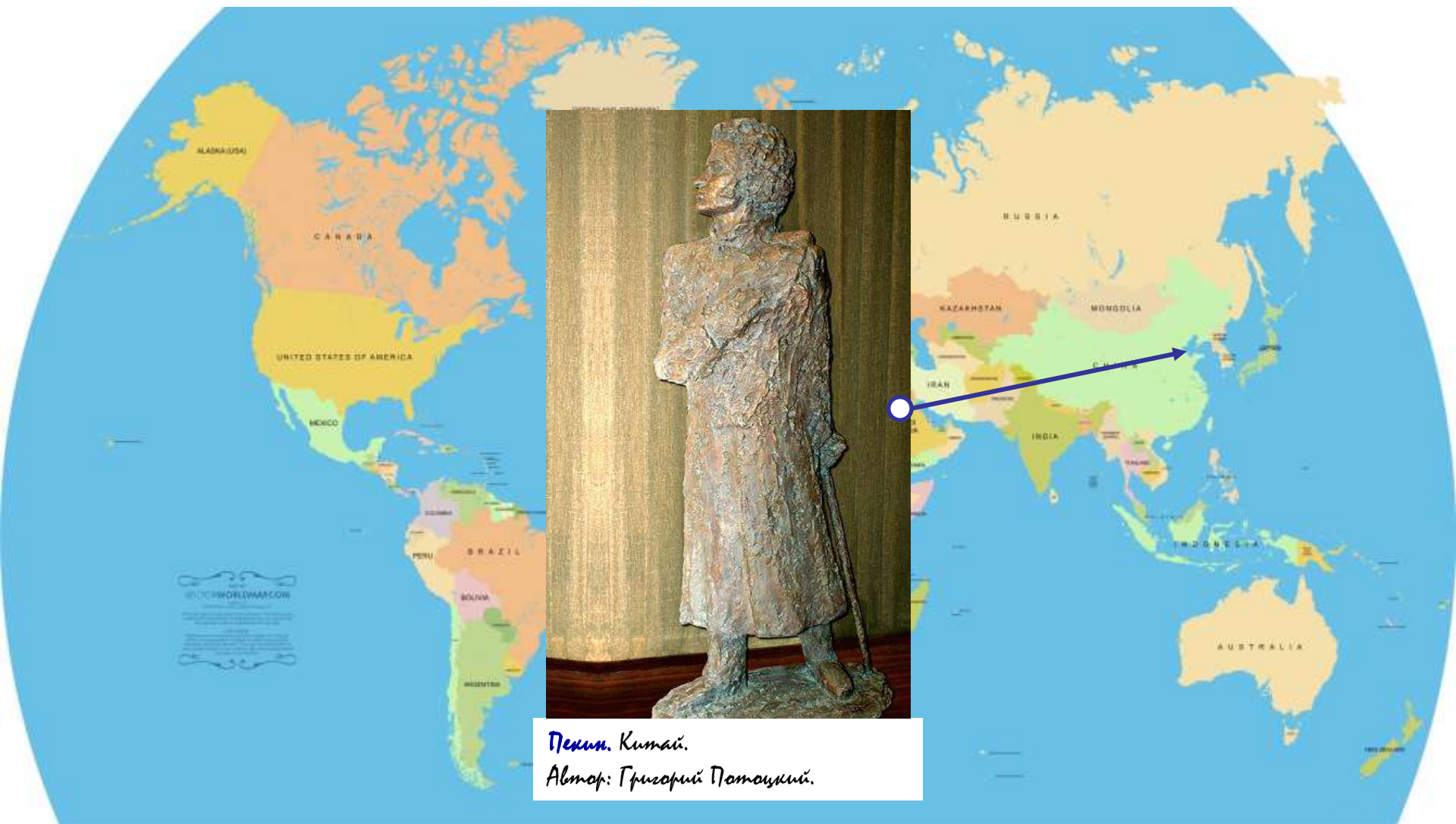
Пекин. Китай. Автор: Григорий Потапкин.

Александра Сергеевича Пушкина знают во всем мире.